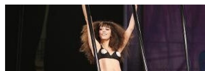
H&M empieza la Navidad con Sonia Rykiel