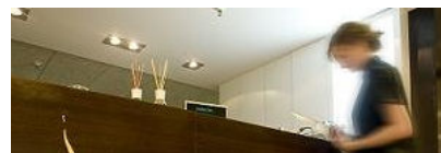
Un spa en El Corte Inglés