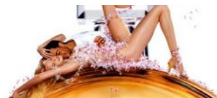
La industria del lujo, tocada pero no hundida