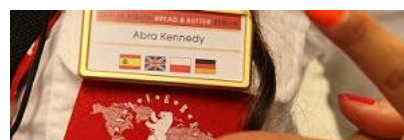
Bread&Butter reserva día en el calendario