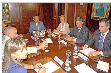
Un momento del encuentro entre diseñadores y miembros de asociaciones textiles de Galicia y Portugal

El hecho de que haya varias ciudades de la comunidad interesadas en acoger esta pasarela muestra que el sector textil de Galicia está muy vivo, pero la mejor forma es colaborar entre todos, por eso proponen la participación de todas las ciudades.