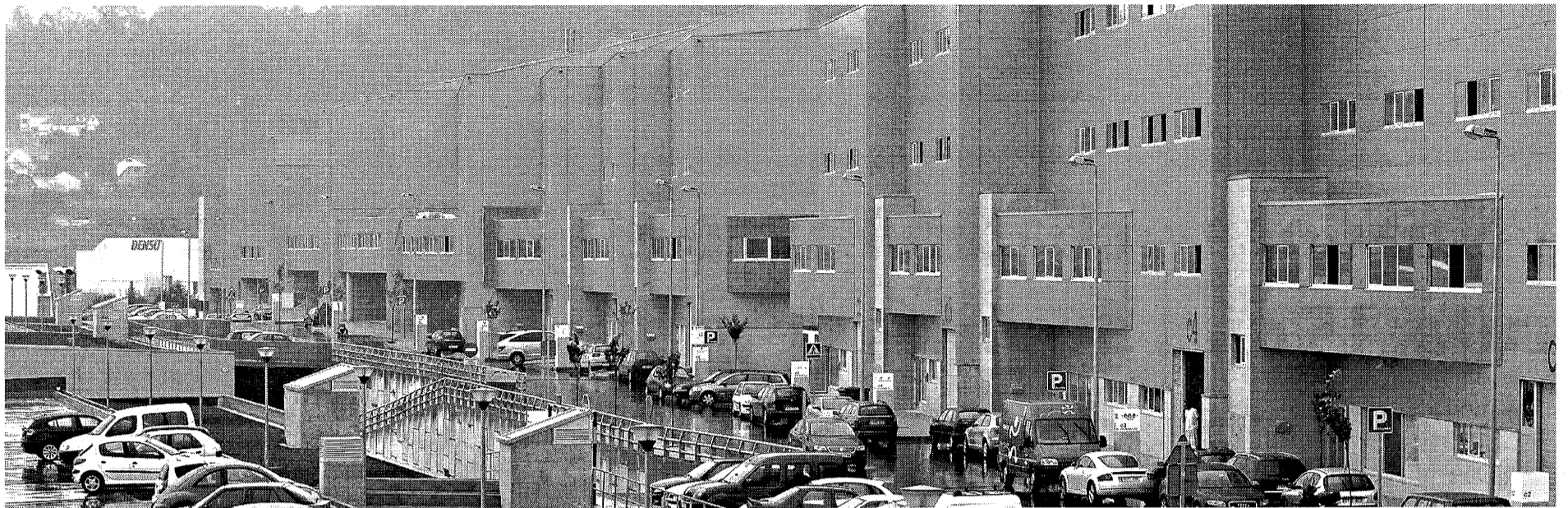
La Ciudad del Textil está integrada por una serie de 44 naves adosadas de idéntica construcción externa fácilmente localizables visualmente en el polígono de Valladares | GUSTAVO RIVAS

La mitad de los 44 cooperativistas ya están instalados en la primera área industrial de Galicia dedicada exclusivamente al sector de la moda