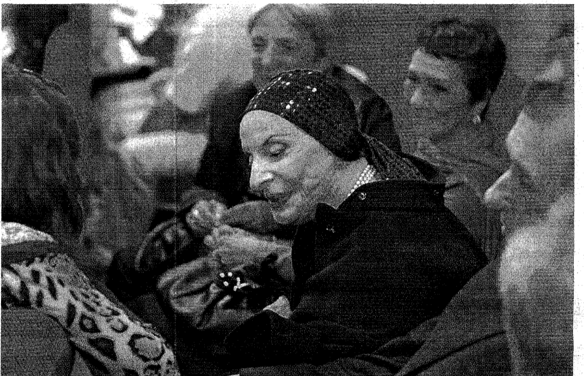
Alicia Alonso asistió como una espectadora más al espectáculo del Ballet Nacional de Cuba