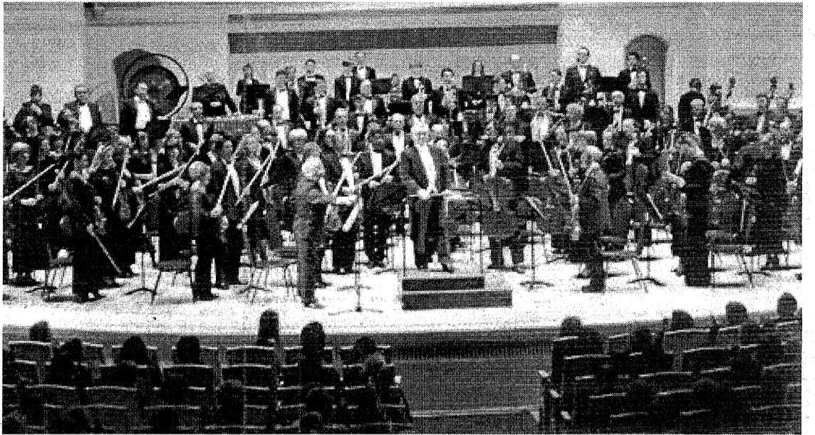
El público que asistió al Centro Cultural Caixanova votó mayoritariamente a la Orquesta Filarmónica de Moscú

El textil gallego se «funde» con Esperanza Aguirre en México. El textil gallego ha iniciado varias acciones de gran proyección en México, bajo la financiación de la Consellería de Economía a través del Igape, como la Quincena especial moda gallega en las tiendas de la famosa cadena Palacio del Hierro o la exhibición de colecciones gallegas en la milla de oro de las compras en la capital azteca. Esperanza Aguirre , que también andaba por allí de misión comercial, se mostró muy interesada por las iniciativas de Cointega, patronal gallega que forma parte del proyecto de Moda España. Además, Aguirre aseguró que hay existe mucho interés entre los empresarios madrileños en conocer el funcionamiento de Texvigo.